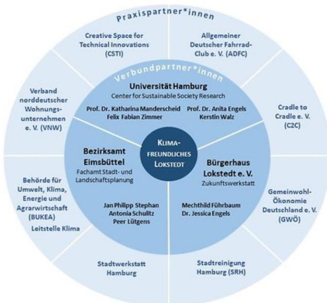
Übersicht der Projektpartner*innen Klimafreundliches Lokstedt

Illustration: Riesenspatz