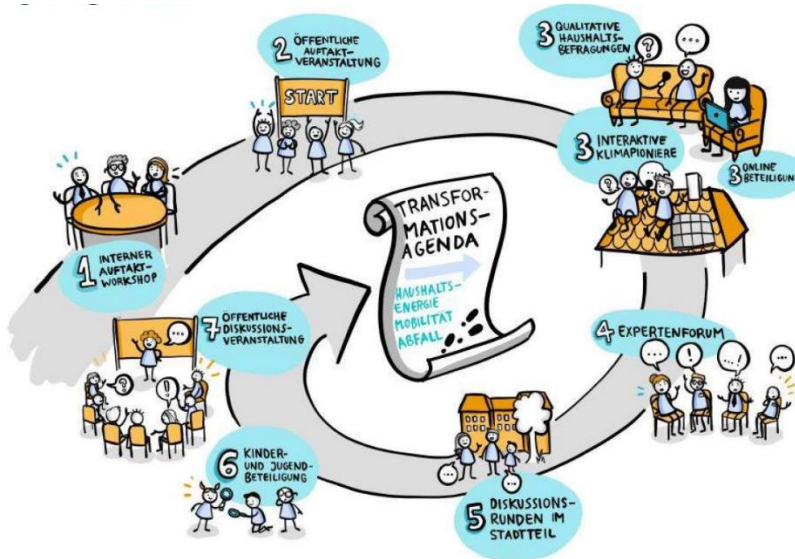
Schema der Bürgerbeteiligung im Forschungsprojekt Klimafreundliches Lokstedt

Illustration: Riesenspatz